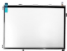
10.1" Back light module