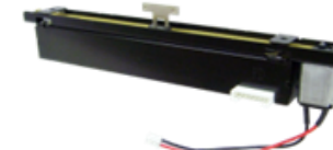
60mm/100mm Slide VR with motor