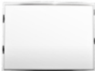
19-21.5" Back light module