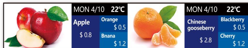
47.6-58.5" LCM module