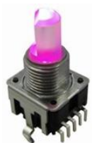
12mm Encoder with RGB LED