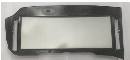
12.3-15.1" Back light module